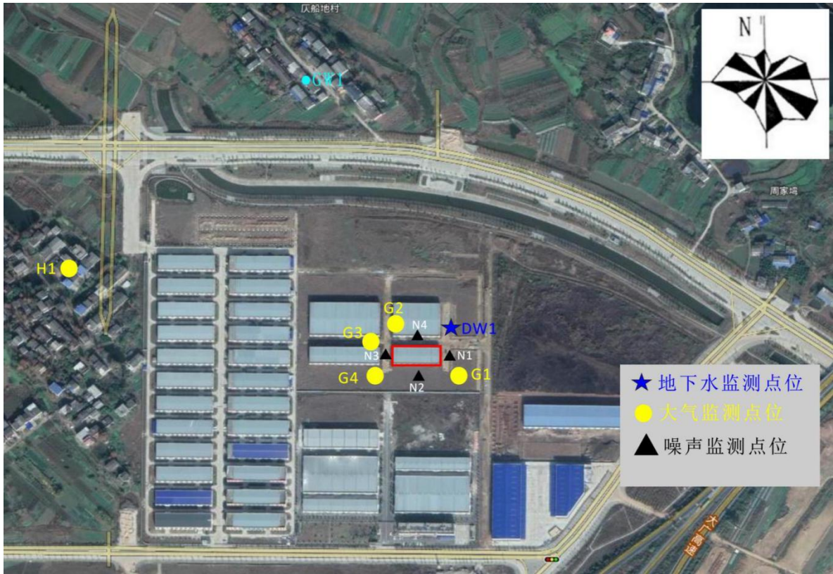
图 6-1 监测点位示意图