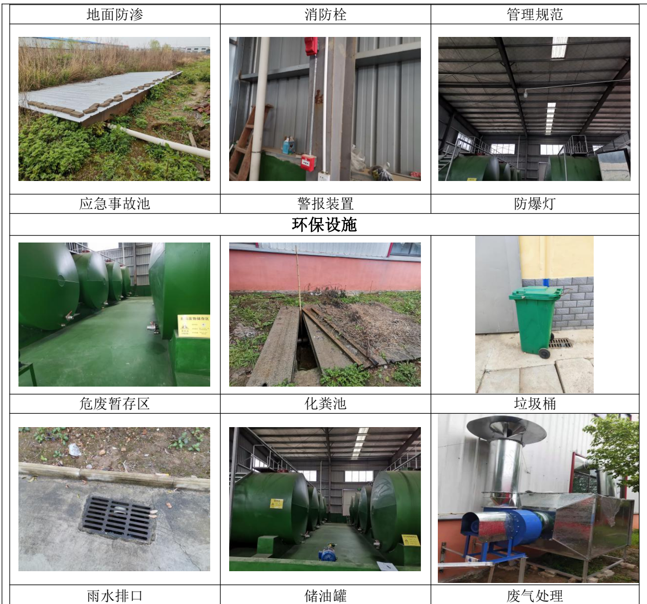
图 8-1 环保与应急设施现场照片