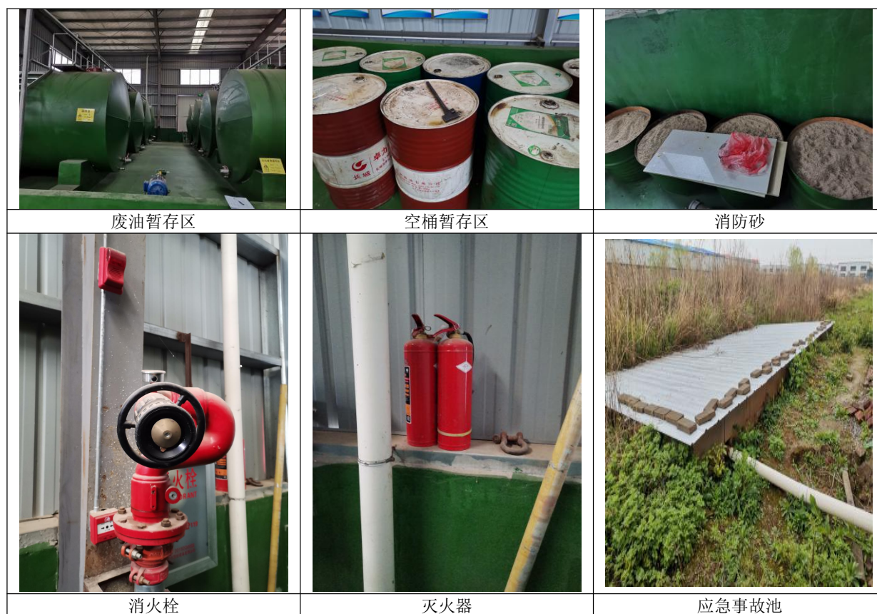
图 2-1 项目现场情况